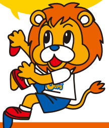
CUPSマスコットキャラ バディくん