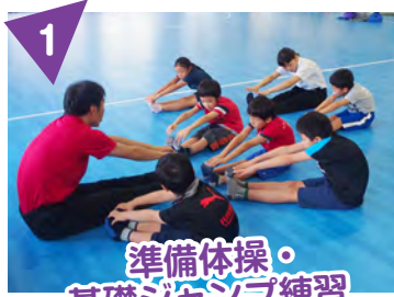
1 準備体操・ 基礎ジャンプ練習

柔軟体操・マット運動・体幹トレーニングなどで身体を動かした後、ストレートジャンプ、抱え跳び、開脚跳びなど基本動作を身に付けると同時に全身のパワーアップを目指します。